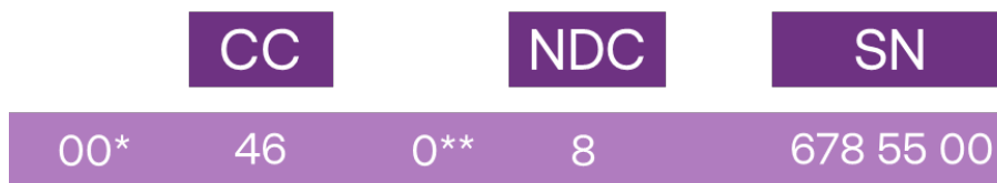
Figur 2 - Som nämnts ovan i avsnitt 1 finns det också prefix. Prefix är inte en del av det internationella E.164-numret. Bl.a. det internationella prefixet 00 (*) och det nationella prefixet 0 (**). Deras placering framgår i figuren ovan. Som exempel används telefonnumret till PTS (08-678 55 00).

Den maximala nummerlängden vid ett utgående internationellt samtal är 15 siffror inklusive landskoden. Eftersom Sverige har en tvåsiffrig landskod (46) innebär det att den teoretiskt maximala nummerlängden för nationell numrering i Sverige är 0 + 13 siffror (där "0" är det nationella prefixet). Som nämnts ovan räknas varken det internationella prefixet (00) eller nationella prefixet (0) som en del av ett E.164-nummer.