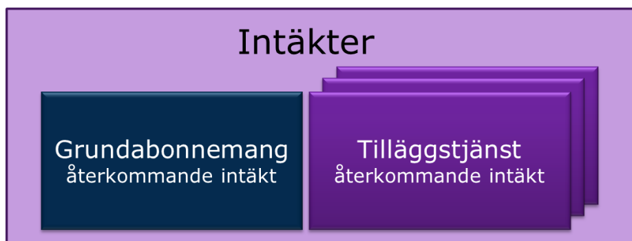
Figur 2: Intäkter för grundabonnemang och tilläggstjänster

PTS utgångspunkt är att alla tjänster som levereras som en del i en relevant produkt ska tas i beaktande. Detta innebär att allt som slutkunden betalar genom abonnemanget för den relevanta produkten utgör intäkter som ska beaktas i det ekonomiska replikerbarhetstestet. På motsvarande sätt ska alla sådana kostnader som är förknippade med den relevanta produkten ingå på kostnadssidan i modellen.